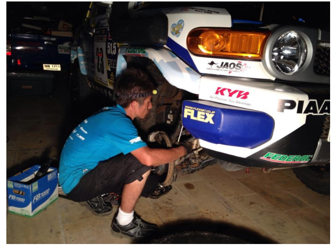
Repair & Maintenance 中央自動車大学の学生たちが毎晩 修理と整備をして無事完走！