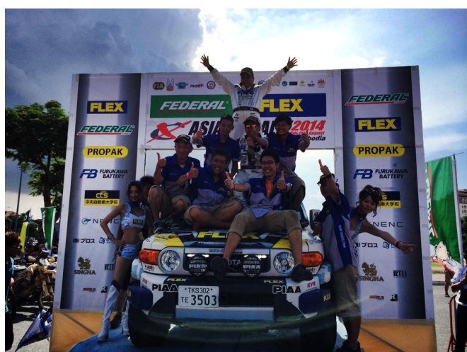
TOYOTA FJ CRUISER ガソリン車3位