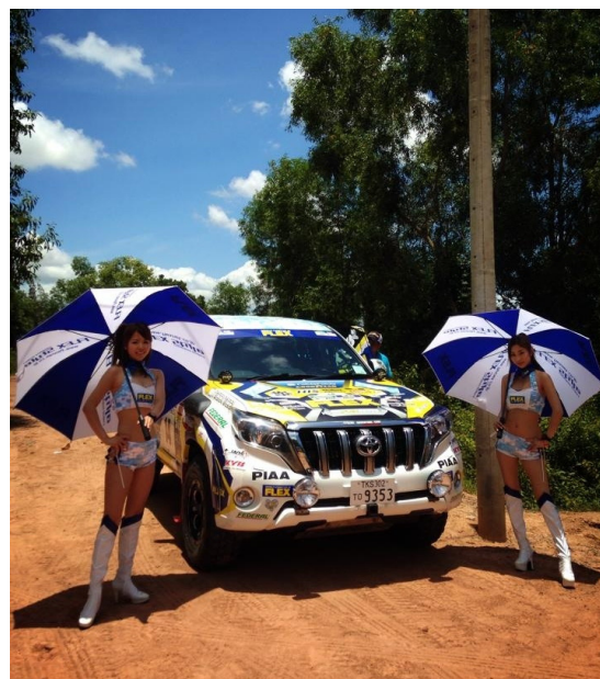
PRADO : LED LAMP (Bumper : LP570、Bonnet : LP530)、LED FOG BLUB (Yellow)、HEAD LIGHT (HID 6000K)、WIPER (AERO VOGUE)