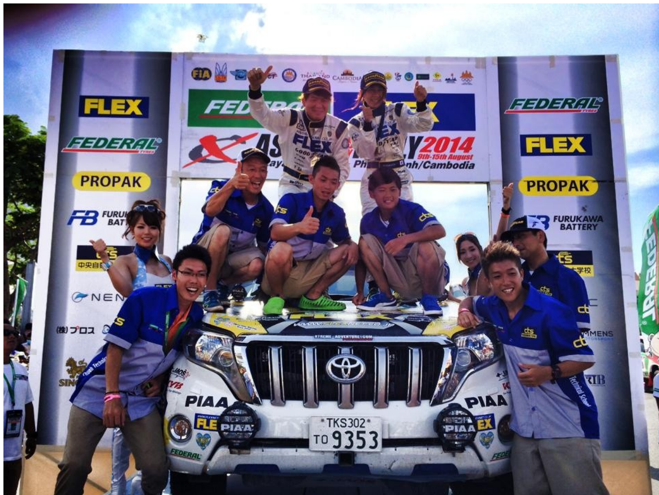
プノンペンのセレモニアルフィニッシュ（トヨタ ランドクルーザー プラド） ガソリン車2位 Ceremonial finish at Phnom Penh Cambodia (TOYOTA LAND CRUISER PRADO)