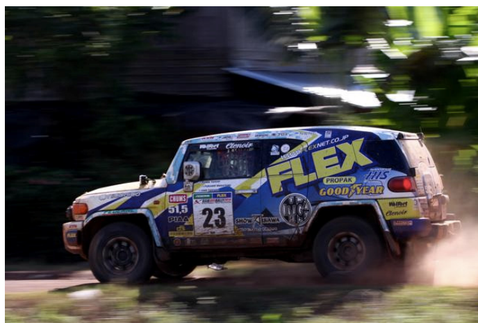
FJ CRUISER : LED LAMP (Bumper:LP570、Bonnet:LP530)、DAYTIME RUNNING LAMP (DR185) HEAD LIGHT (ASTRAL WHITE 4600K)、WIPER (SILICON SNOW WIPER)