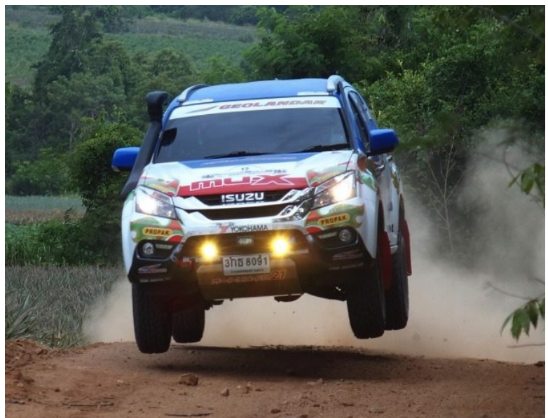
Takuma Aoki Over All 4 th -place finished! (総合4位、日本人最高位でゴール！)