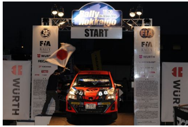
Vitz 専用のランプポッド by タクミクラフト