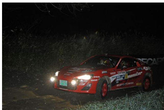
SSS サツナイリバーのナイトセッション