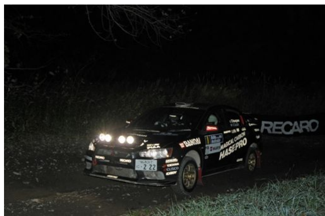
ナイトセッションのハセ・プロランサー