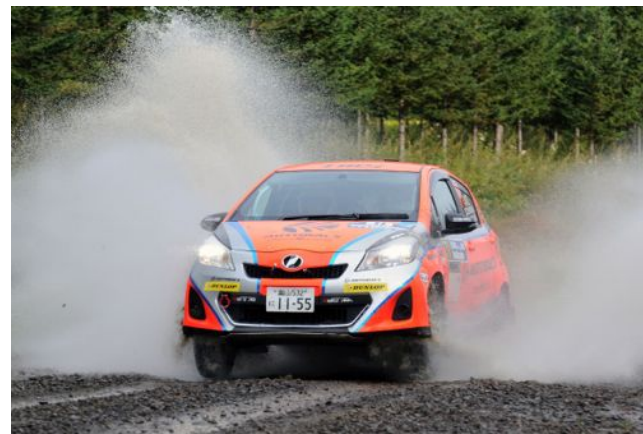
LEG2は場所により雨が降ったため広間でもライトオン