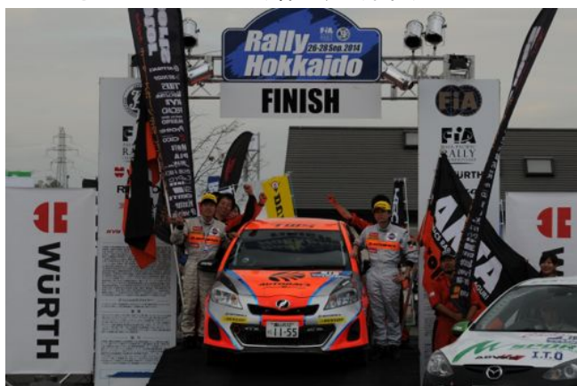
ARTA オートボックス Vitz(石川、石川組)