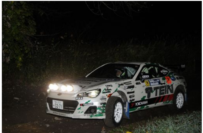
SSS サツナイリバーのナイトセッション