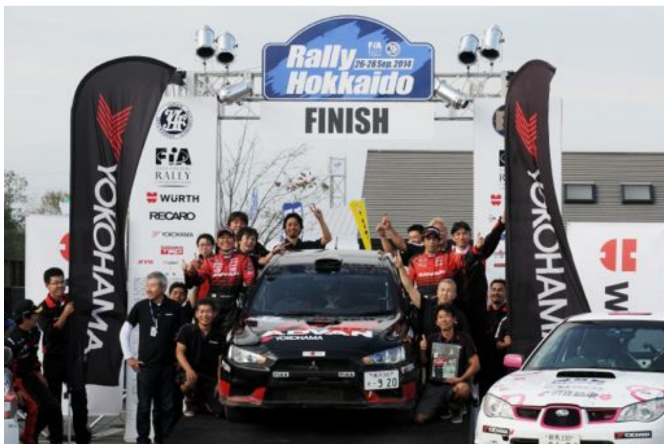
JRC 総合優勝 ADVAN-PIAA ランサー

APRC では HASE・PRO レーシング(長谷川、鈴木組)が総合 16 位(アジアカップ4位)で完走を果たす!