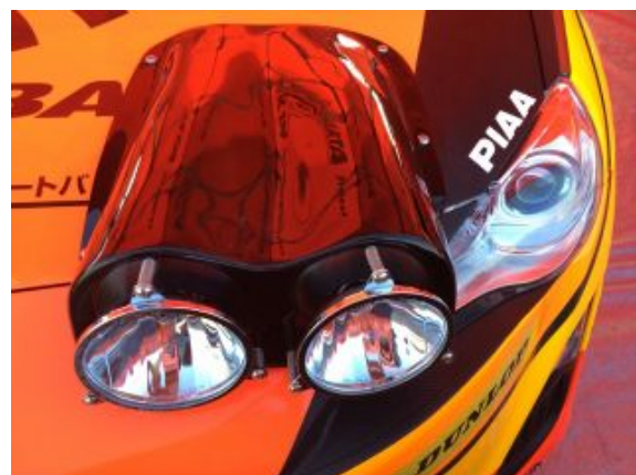
86 専用ランプポッド by タクミクラフト