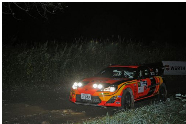
SSS サツナイリバーのナイトセッション