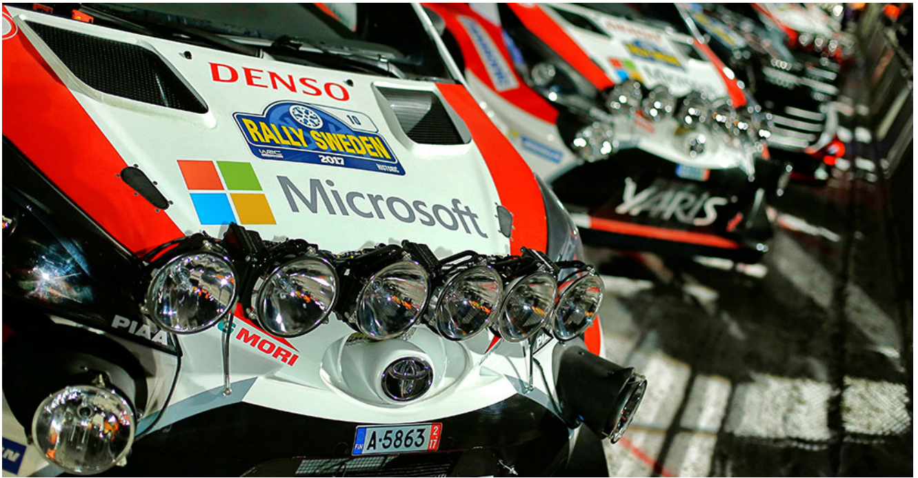
DAY-1 スタート前のYARIS WRC ナイトステージに備えPIAAライティングシステムを装着