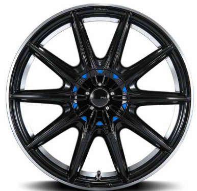
別売品: ブループレート装着