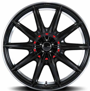
別売品: レッドプレート装着