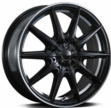
Color: ブラック×アンダーカットクリアー 標準仕様