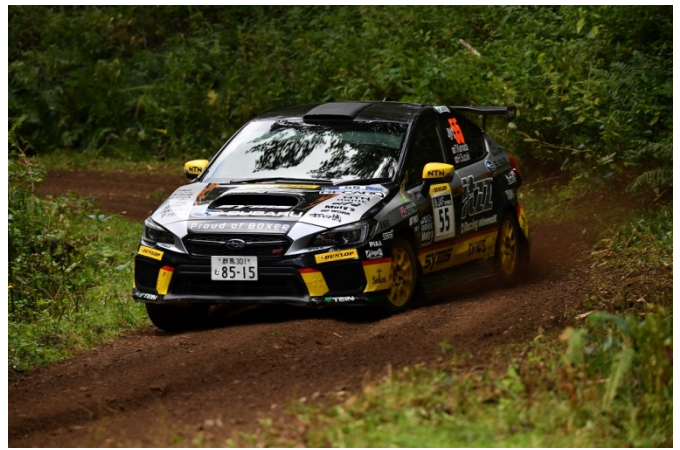
地元北海道で2位表彰台のitzz Rally TeamのSUBARU WRX STI ライティング、ワイパー、オイルフィルターでサポート