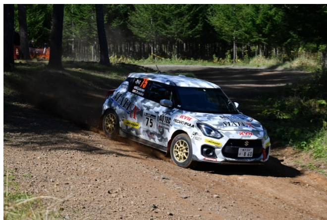
KYB DUNLOP スイフトはチャンピオン争いをリードしているがラリー北海道は惜しくもリタイヤに。