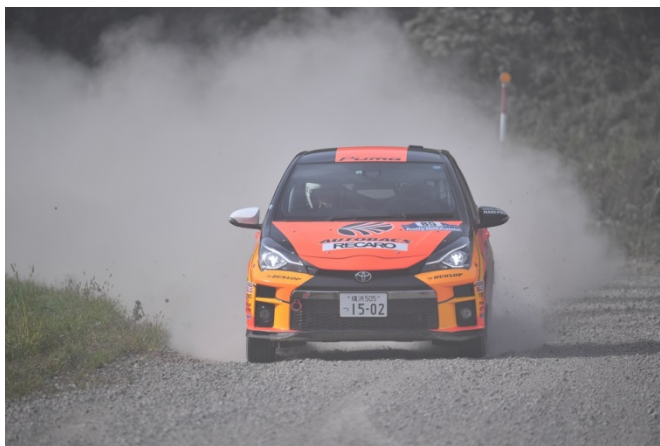
ARTA オートバックスラリーチームは社員メカニックも奮闘し今季初優勝をあげる！