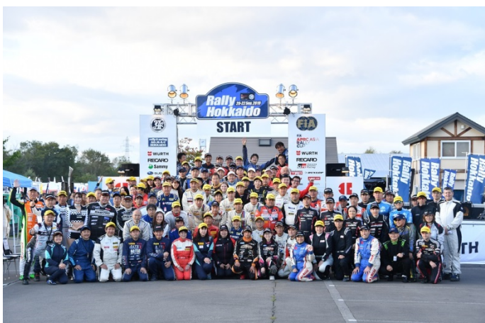
全クルーの集合写真