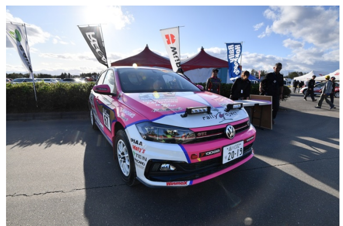
VW POLO GTI でラリー北海道を初完走の竹岡・佐竹選手組