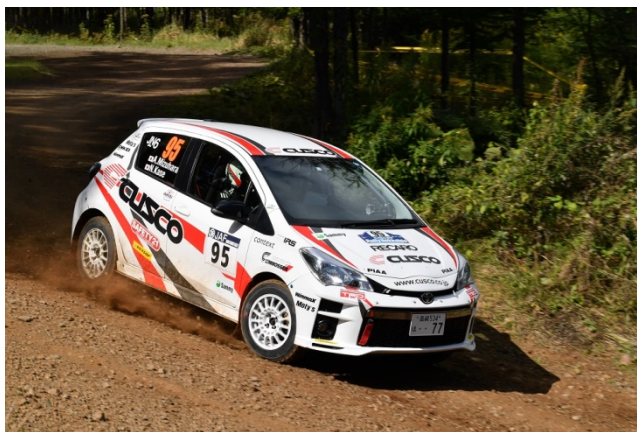
砂埃を巻き上げて激走する CUSCO DL Vitz (CVT でラリー北海道の高速グラベルを走破)