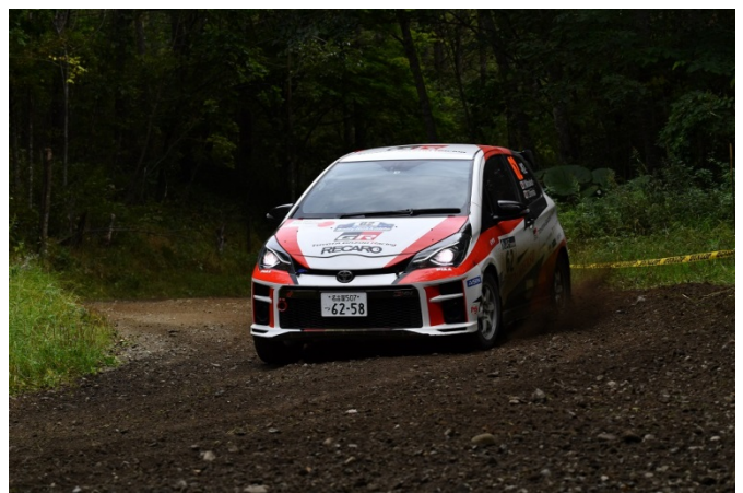
ライティングのほか、YARIS WRC にも供給している撥水シリコンワイパーを装着（種類は異なります）