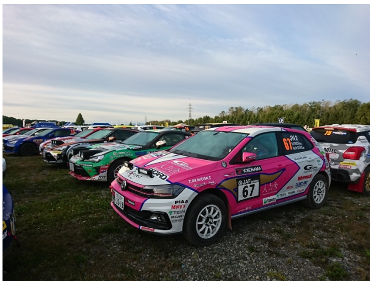
土曜日、早朝のパークフェルメ (車両保管)・・・多くのマシンが前日のナイトセッションで使用したランプポッドを装着