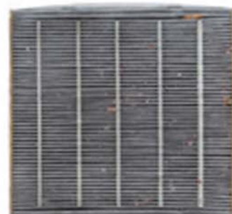
汚れたエアコンフィルター