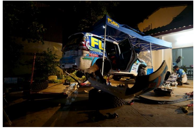
サービスに戻った車両を夜遅くまで修理&整備