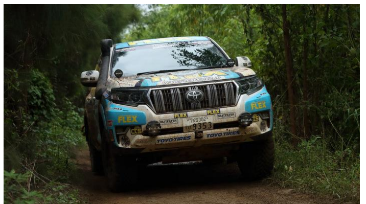
舗装路のリエゾンのあとは固い路面の高速ダート～ジャングルを走破！