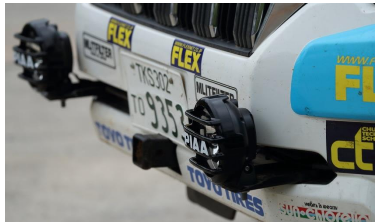
カンボジア王国の首都プノンペンでフィニッシュ！ ⇒アジアクロスカントリーラリー公式ページ http://www.r1japan.net/axcr/index_ja.html