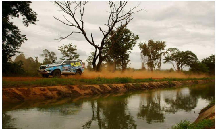
水地獄！ 水路に陥落するも地元民の協力で脱出！