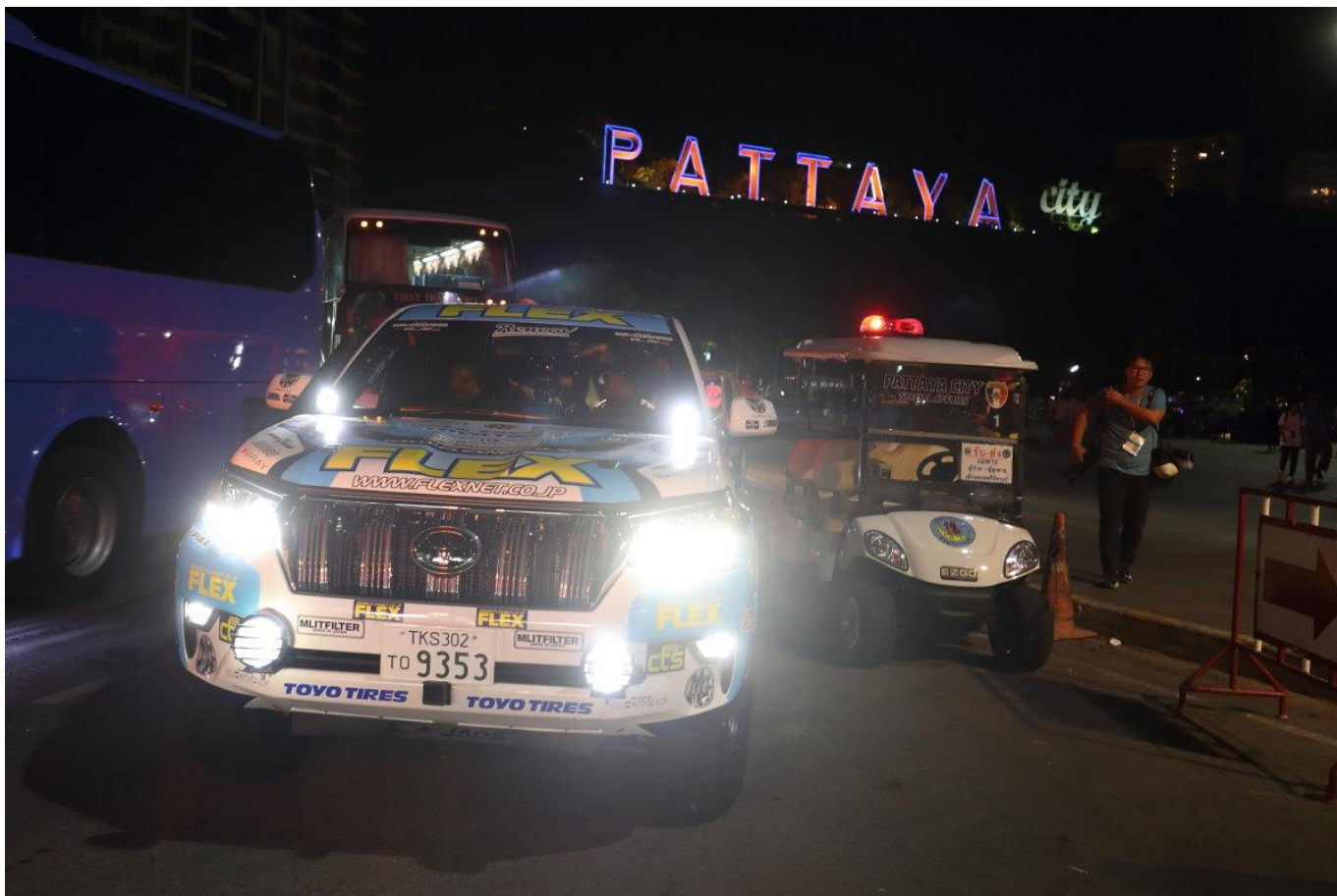
PATTAYA をスタート！ PIAA LED ランプが白く輝く